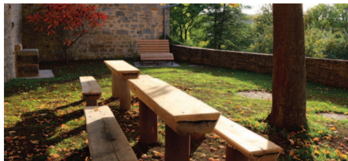
2022 über das Regionalbudget gefördert: die Sitzgruppe auf dem „Stadt balkon“ bei der VG.

Für jedes Kriterium können bis zu drei Punkte vergeben werden. Die Projekte mit der höchsten Punktzahl werden mit Hilfe des Regionalbudgets gefördert.