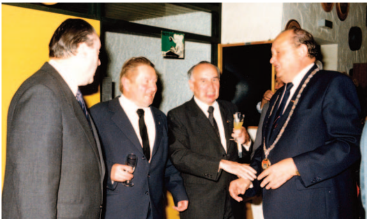
Empfang zur 1.200-Jahr-Feier des Stadtteils Eußenhausen im örtlichen Kulturheim (1988).

Oskar Herbig starb am 29. September 1998 im Alter von 74 Jahren.