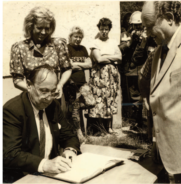
Hohen Besuch empfing Oskar Herbig im Juli 1990. Niemand Geringeres als Außenminister Hans-Dietrich Genscher und Zyperns Staatspräsident Georges Vassiliou landeten auf dem Sportplatz in Eußenhausen, um die damals noch DDR-Nachbarstadt Meiningen zu besuchen. Ein Eintrag ins „Goldene Buch“ der Stadt Mellrichstadt durfte aber selbstverständlich auch nicht fehlen.